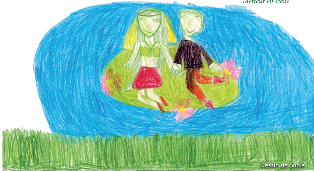
Dessin de Sonia