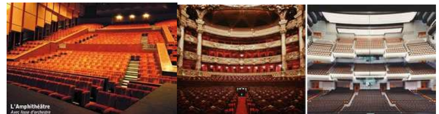
L'Amphithéâtre Avec fosse d'orchestre